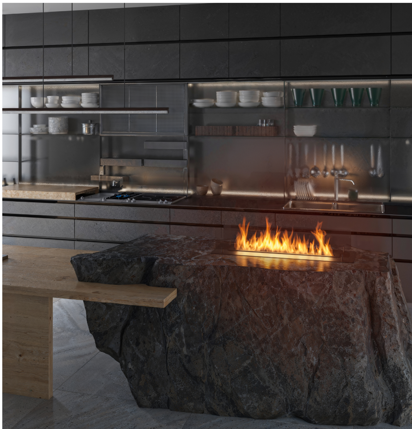
Biokominek Insert Black 1000 (LONGFIRE)